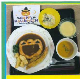
ハロウィンカレー