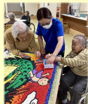
下絵に貼り付けました。

スポーツの秋です!! さまざまな競技に参加していただき 紅白戦大いに盛り上がりました。