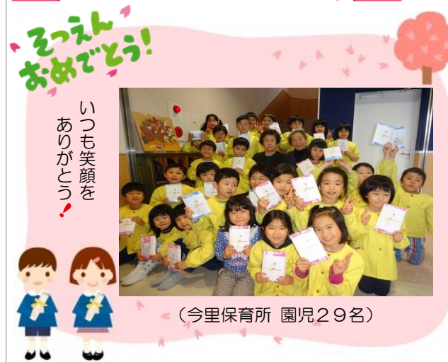
(今里保育所 園児29名)