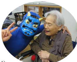
節分 (デイサービス・特養)