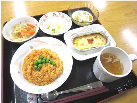
~チキンライス~ たまには、お子さんと食べた メニューを思い出して・・・