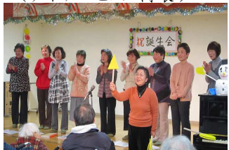
2月誕生会(コーラス) コールハーブの皆様