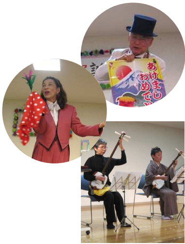
1月・3月誕生会 (マジック・三味線・オカリナ) ボラエモンの皆様

~ The nursing home "Hanazono garden" is always full with smile places. ~