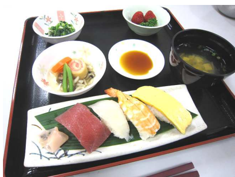
~にぎり寿司~ 目の前でお好きなネタを 握ります