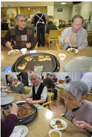
お好み焼き作り (ケアハウス)